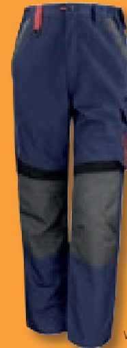
NAVY/BLACK (282/BLK) VERFÜGBAR AB DEN 1. JULI 2014