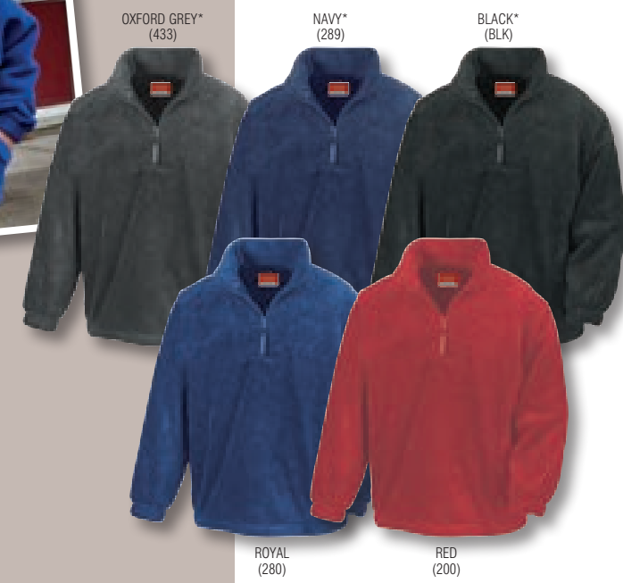
OXFORD GREY* (433)

auch für Kinder und Jugendliche erhältlich (Seite 390)